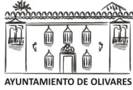
AYUNTAMIENTO DE OLIVARES