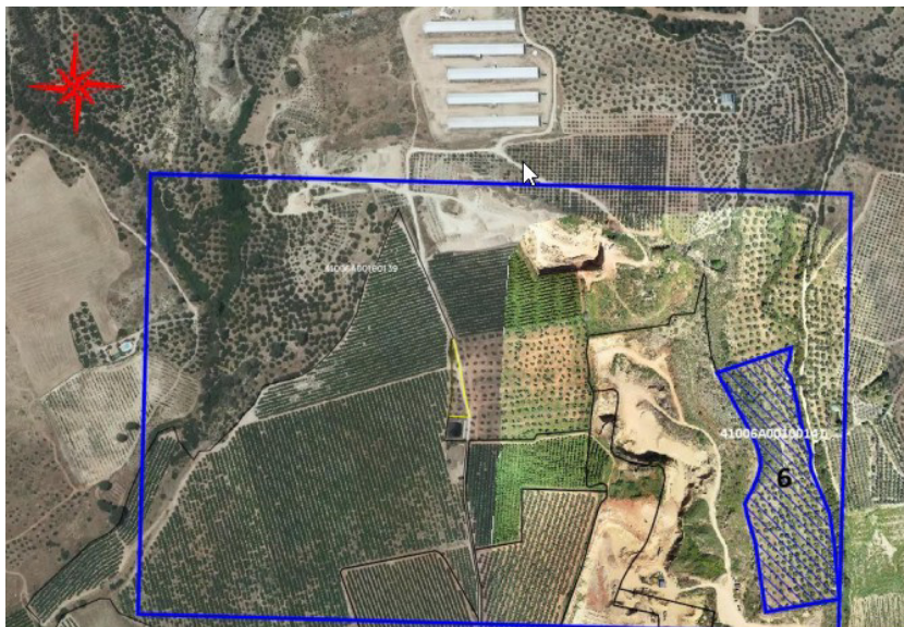
COORDENADAS PARCELA 141