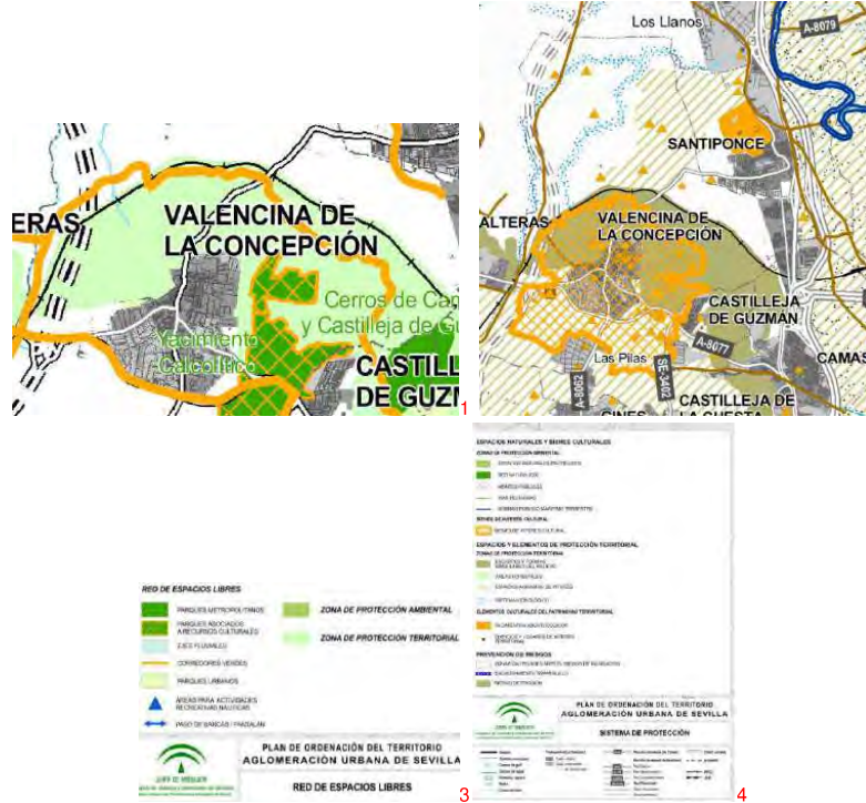
3.zona de protección territorial según plano de espacios libres del POTAAU