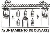
AYUNTAMIENTO DE OLIVARES