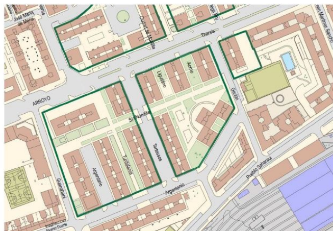
Corrección de error.