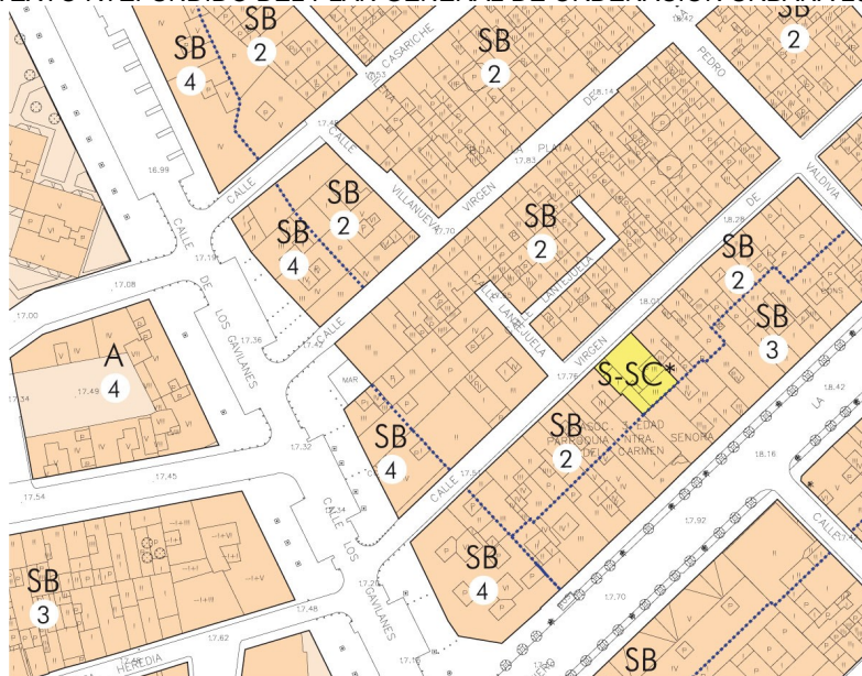
PLANO DE ORDENACIÓN PORMENORIZADA COMPLETA (HOJA 15-16)